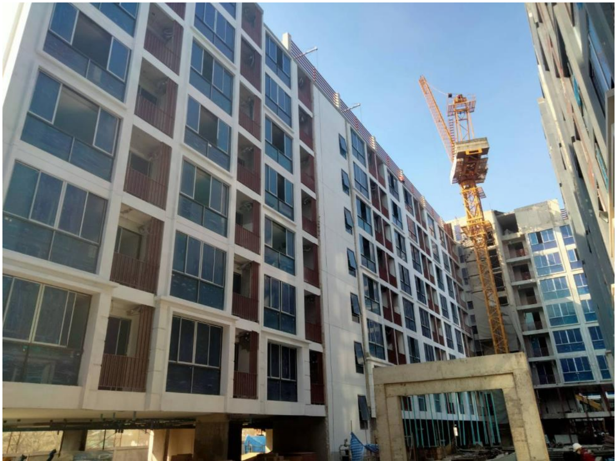
รูปที่ 1.3 สภาพโครงการในปัจจุบัน