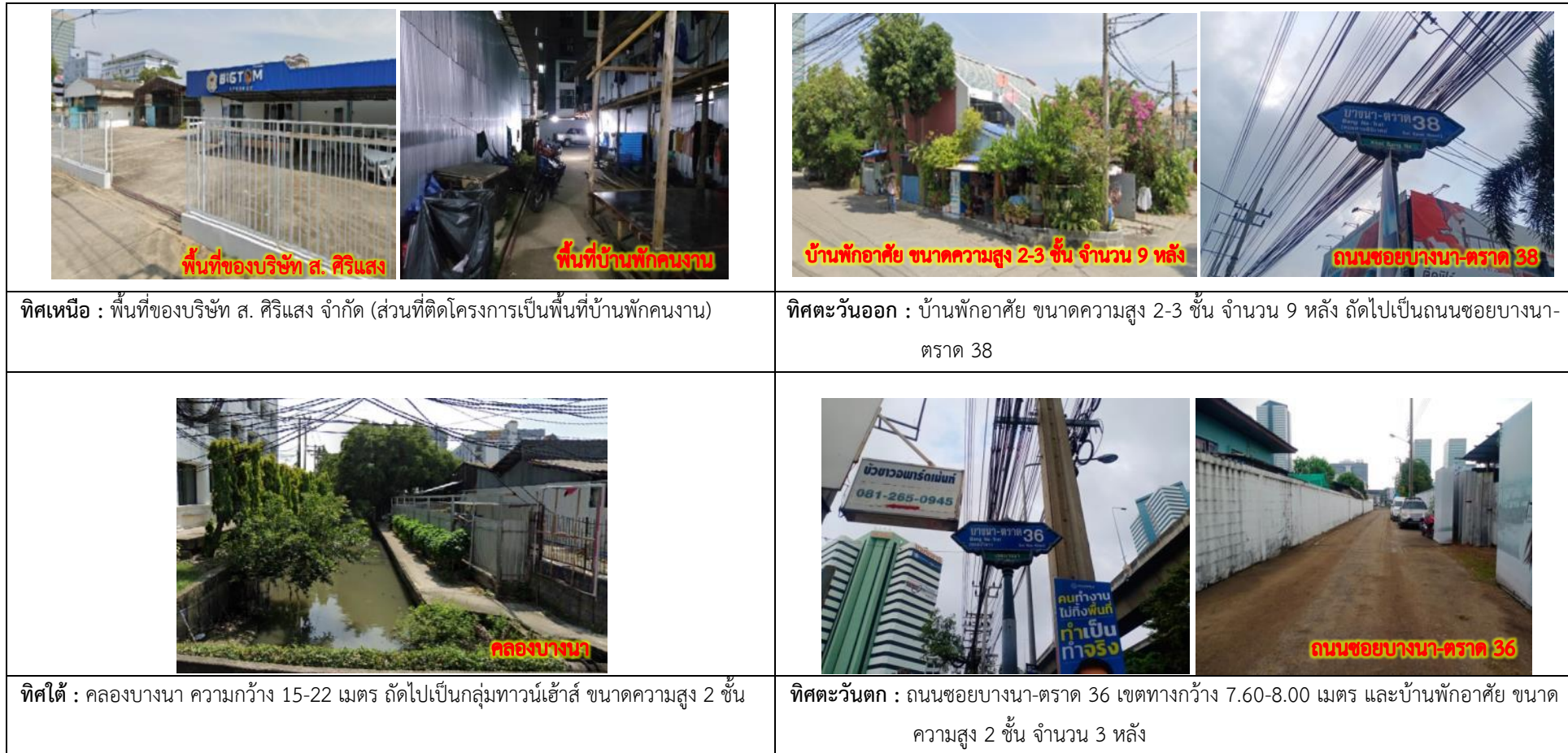
รูปที่ 1.2 แสดงการใช้ประโยชน์บริเวณพื้นที่โครงการและพื้นที่ใกล้เคียง